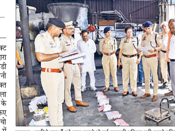
झज्जर। नशीले पदार्थों को नष्ट करने से पूर्व कागजी प्रक्रिया पूरी करते पुलिस अधिकारी।