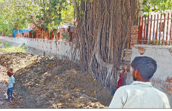
बहादुरगढ़। माइनर की दीवार बनाने का चल रहा कार्य।

जाता है। फिलहाल पुलिया के पास दीवार बनाई जा रही है। आगे जरूरत पड़ने पर और काम भी करा दिया जाएगा। माइनर में कचरा डालने वालों को चेतावनी देते हुए एसडीई ने कहा कि इस दिशा में सख्त