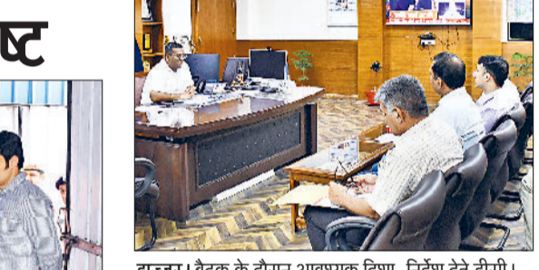
झज्जर। बैठक के दौरान आवश्यक दिशा-निर्देश देते डीसी।