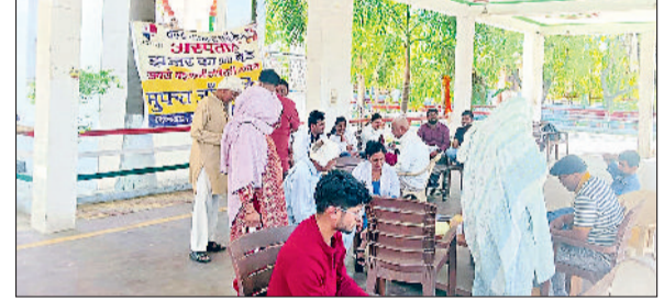
झज्जर। शिविर में स्वास्थ्य जांच कराने पहुंचे ग्रामीण।