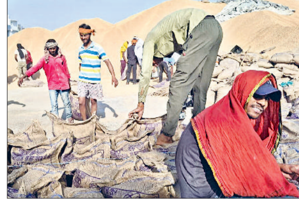
झज्जर। फसल पैकिंग व उठान कार्य में जुटे श्रमिक।