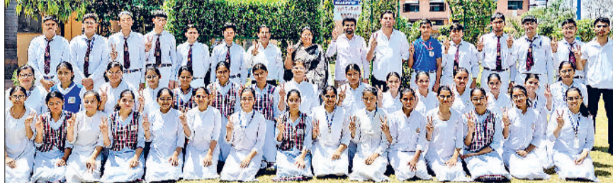
झज्जर। शिक्षकों के साथ विजय विहन बनाते हुए होनहार विद्यार्थी।