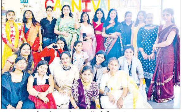
बहादुरगढ़। कार्यक्रम में स्टाफ कॉर्म्स की छात्राएं।

गर्ल्स कॉलेज में हुआ कॉर्म्स कनिवल का आयोजन