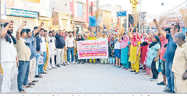
झज्जर। आंबेडकर चौक पर विरोध प्रदर्शन के दौरान नारे लगाते हुए सफाई कर्मचारी।

समाधान न होने के कारण कर्मचारी प्रदर्शन करने को मजबूर