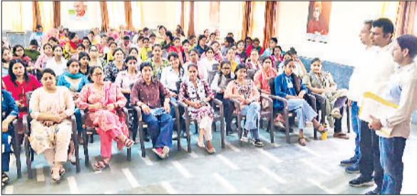
बहादुरगढ़। प्रशिक्षण प्राप्त करती स्वयंसेविकाएं व स्टाफ सदस्य।

झज्जर। पूर्व केंद्रीय मंत्री बोरेंद्र सिंह बुधवार को रोहतक रोड स्थित चौधरी छोटेराम धर्मशाला में कांग्रेस कार्यकर्ताओं की बैठक लेंगे। दोहरा बाद करीब चार बजे वे पूर्व सांसद बृजेंद्र सिंह के नेतृत्व में निकाली जा रही सद्भाव यात्रा के संबंध में झज्जर व बाल्शी हलके के कार्यकर्ताओं को जिम्मेदारियां सौंपेंगे।