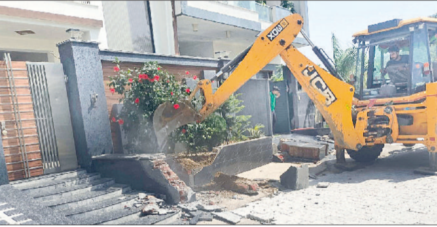
हरिभूमि न्यूज बहादुरगढ़

झज्जर रोड स्थित ओमेक्स परिसर में मंगलवार को अवैध निर्माणों के खिलाफ प्रशासन ने सख्त कार्रवाई करते हुए 50 से अधिक मकानों के बाहर बने रैंप और चबूतरे ध्वस्त कर दिए। यह कार्रवाई पंजाब एवं हरियाणा हाईकोर्ट के आदेशों के अनुपालन में की गई। अभियान